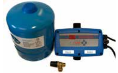
Tillbehör Welldrive sats art nr 5818746