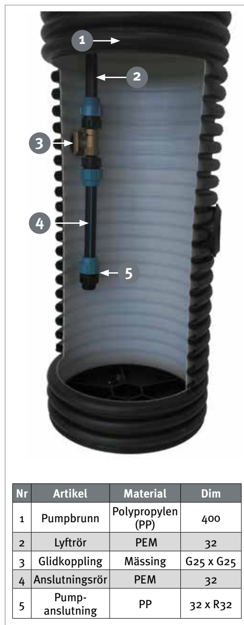
Altech Pumpbrunn Art nr: 561 92 40, 561 92 41