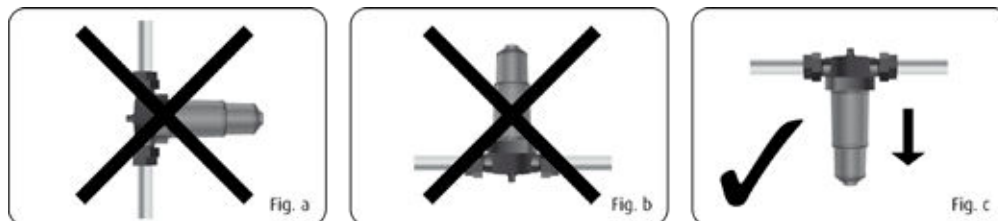
Förfiltret PrePLUS och filtersystemet ska alltid installeras vertikalt, som på figur C.

FörfiltretPLUS och filtersystemet ska alltid installeras vertikalt, som på figur C.