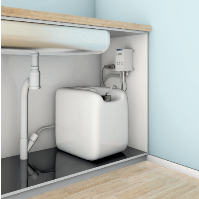
Ekotreat-enheten placerar man med fördel under diskbänken där man också förvarar dunken med fällningsmedel.