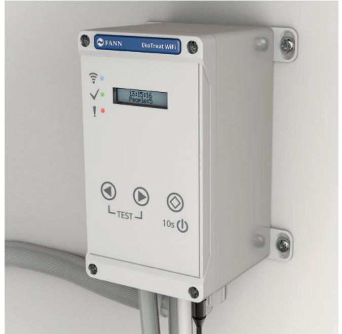
EkoTreat WiFi ansluts mot tillgängligt WiFi-nätverk och kontrolleras enkelt på distans med FANN Config.