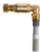
5 Diffusörarmatur inkl. backventil