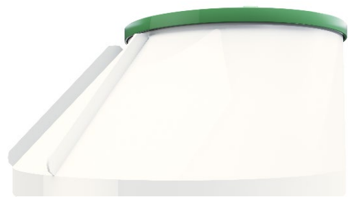
Reningsverket kan levereras med konisk hals.