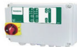
Inomhusskåp vid 3-faspumpar