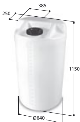
Volym 320 liter Art nr: 10321, vikt 20,0 kg Med Ø 150 mm skruvlock