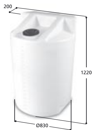
Volym 520 liter Art nr: 10522, vikt 26,0 kg Med Ø 150 mm skruvlock