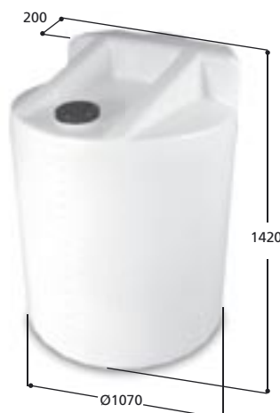
Volym 1000 liter Art nr: 11001, vikt 40,0 kg Med Ø 150 mm skruvlock