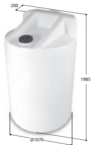
Volym 1500 liter Art nr: 11015, vikt 60,0 kg Med Ø 150 mm skruvlock