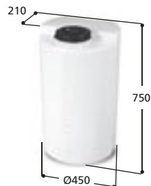
Volym 100 liter Art nr: 10101, vikt 7,5 kg Med Ø 150 mm skruvlock