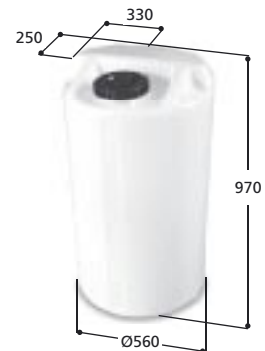
Volym 200 liter Art nr: 10201, vikt 12,0 kg Med Ø 150 mm skruvlock